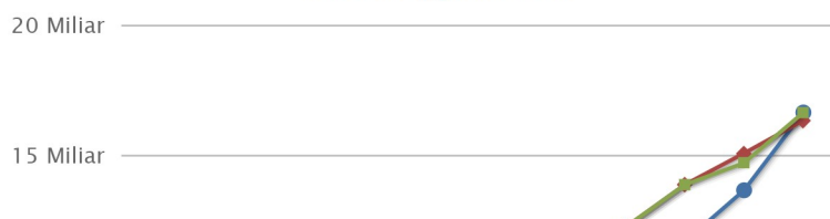
Penyerapan Anggaran Tahun Anggaran: 2019

adanya kejelasan lokus pelatihan, peningkatan sdm dan sarana prasarana pelatihan